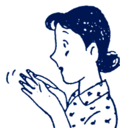
かぶれ、しもやけに